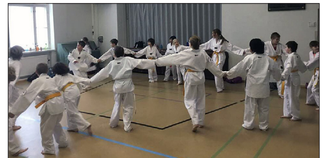
Leikkiä treenin välissä.