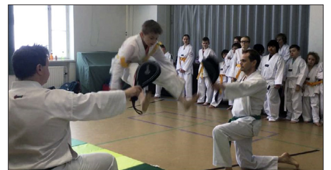
Eliksen upea Kawi ap chagi (kahden v-muodossa olevan jalan hyppyetupotku)

– Hyvä, että välillä on rannatreenit ja välillä vähän